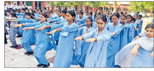
कैथल। योगाभ्यास करती छात्राएं।