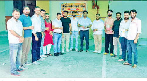
जीद। पानी की छबील लगाए एबीवीपी कार्यकर्ता।