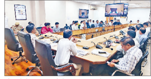
जीद। वीसी में भाग लेते डीसी व अन्य अधिकारी।

को जिम्मेदारी सौंपी है, वह लगातार पंजाब में लोगों के बीच में रह कर मीटिंग करके जिसमें लोगों की भारी भीड़ जमा होती है। पार्टी के अंदर लोगों को शामिल करवा रहे हैं। क्योंकि प्रदेश में कांग्रेस का भी लंबे समय से राज रहा है। कांग्रेस से लोग ऊब चुके हैं। वहां पर किसी भी दल का कोई समर्थन नहीं रहा है। आने वाले जनमत में कांग्रेस पार्टी पूरी तरह से खत्म हो जाएगी और प्रदेश में राष्ट्रीय स्तर पर सभी प्रदेशों में भाजपा की सरकार बनती जा रही है।