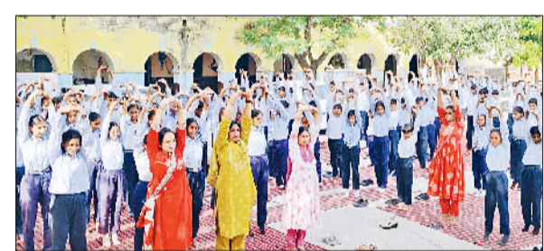
कैथल। स्कूल में योगाभ्यास करते स्टाफ सदस्य तथा विद्यार्थी।

विरोध जताया। हालांकि अभी तक सड़क पर ब्लॉक नहीं लगाए गए हैं, लेकिन संभावित निर्माण को लेकर लोगों में असंतोष देखा जा रहा है। प्रदर्शनकारियों का कहना है कि ब्लॉकों की सड़क ज्यादा टिकाऊ नहीं होती और इससे आमजन को परेशानी होगी। उन्होंने चेतावनी दी कि यदि सड़क ब्लॉकों से बनाई गई तो वे इसका और भी बड़ा विरोध करेंगे। नागरिकों ने प्रशासन से मांग की कि सड़क को तारकोल युक्त मजबूत काली सड़क के रूप में ही बनाया जाए।