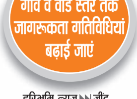
हरिभूमि न्यूज >>> जीद

अभियान को सफल बनाने के लिए सभी आपसी समन्वय से करें कार्य