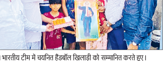
उच्चा। भारतीय टीम में चयनित हैंडबॉल खिलाड़ी को सम्मानित करते हुए।