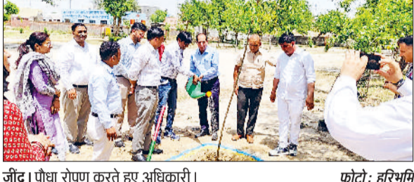
जौद। पौधा रोपण करते हुए अधिकारी।

मेजर इन मैथ में 40 सीटों पर 25 व बैचलर ऑफ साइंस विद मेजर