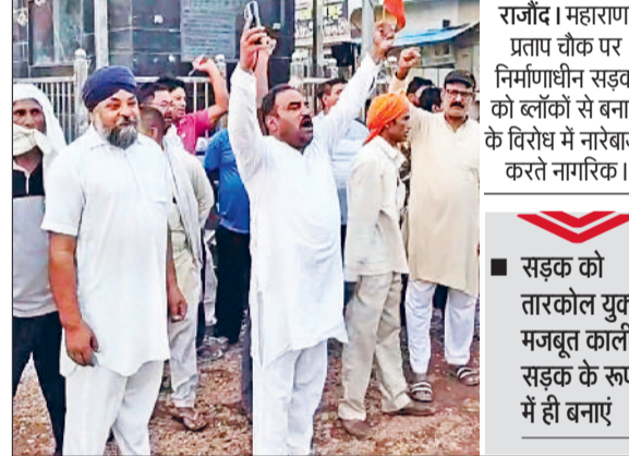
राजौड़। महाराणा प्रताप चौक पर निर्माणाधीन सड़क को ब्लॉकों से बनाने के विरोध में नारेबाजी करते नागरिक।

शहर में निर्माणाधीन मुख्य सड़क को ब्लॉक पावर ब्लॉकों से बनाए जाने के प्रस्ताव के विरोध में नागरिकों ने जोरदार प्रदर्शन किया। लोगों ने सड़क निर्माण विभाग के खिलाफ जमकर नारेबाजी की और स्पष्ट रूप से मांग रखी कि सड़क ब्लॉकों की बजाय तारकोल (काली) सड़क बनाई जाए। देर शाम करीब 7 बजे के आसपास महाराणा प्रताप चौक पर बड़ी संख्या में नागरिक एकत्रित हुए और उन्होंने