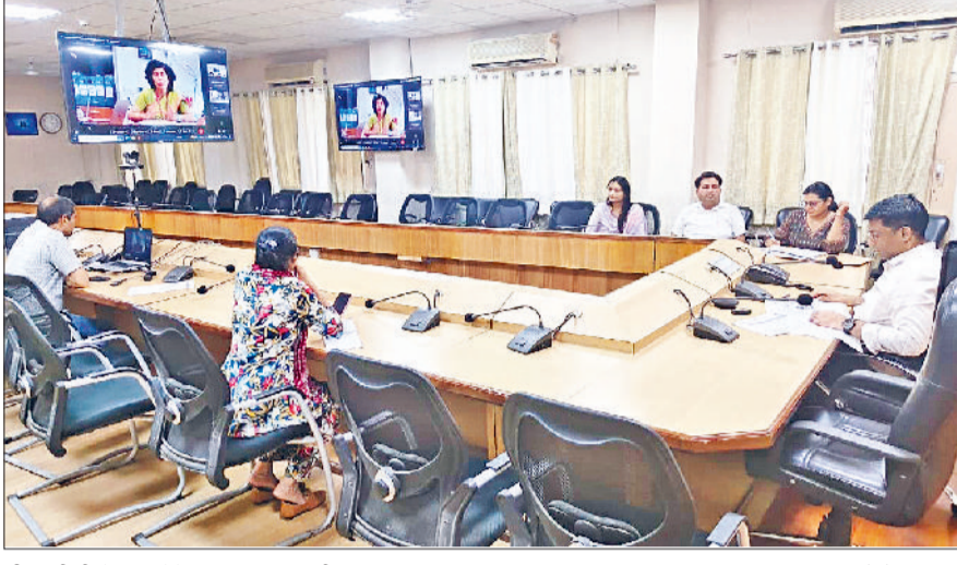
जीद। वीसी में भाग लेते स्वास्थ्य अधिकारी।

टीबी मुक्त भारत अभियान के अंतर्गत चलाए जा रहे 100 दिवसीय विशेष अभियान की प्रगति एवं आगामी कार्ययोजना को लेकर शुक्रवार को लघु सचिवालय के सभागार में उपायुक्त मोहम्मद इमरान राजा की अध्यक्षता में समीक्षा बैठक का आयोजन किया गया। इससे पूर्व एएस एंड एमडी (एनएचएम) ने वीडियो कॉन्फ्रेंस के माध्यम से टीबी मुक्त भारत अभियान को लेकर आवश्यक दिशा निर्देश दिए। उपायुक्त ने अधिकारियों को निर्देश देते कहा कि अभियान को गंभीरता से लेते सभी विभाग आपसी समन्वय के साथ कार्य करें ताकि अधिक से अधिक लोगों तक स्वास्थ्य सेवाओं का लाभ पहुंचाया जा सके और टीबी उन्मूलन के लक्ष्य को समय पर हासिल किया जा सके। कहा कि टीबी केवल स्वास्थ्य संबंधी बीमारी