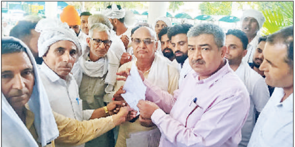
कैथल। फ्लाईओवर के विरोध में एसडीएम को ज्ञापन सौंपते कालोनीवासी।

शहर में सचिवालय के पास करनाल रोड और नए बस स्टैंड पर प्रस्तावित फ्लाईओवर निर्माण के विरोध में लोगों का गुस्सा लगातार बढ़ता जा रहा है। शुक्रवार को नगर सुधार समिति कैथल के बैनर तले शहरवासियों, व्यापारियों और